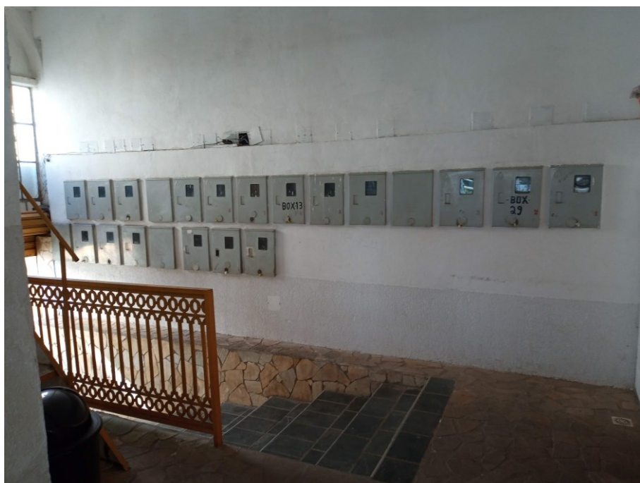
Figura 13 - Vista entrada de serviço salão principal (padrões de Energia)