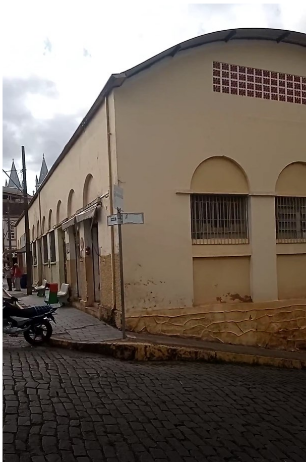
Figura 8 - Esquina Fachada Rua Tenente Francisco Dias / Travessa Tobias Pereira