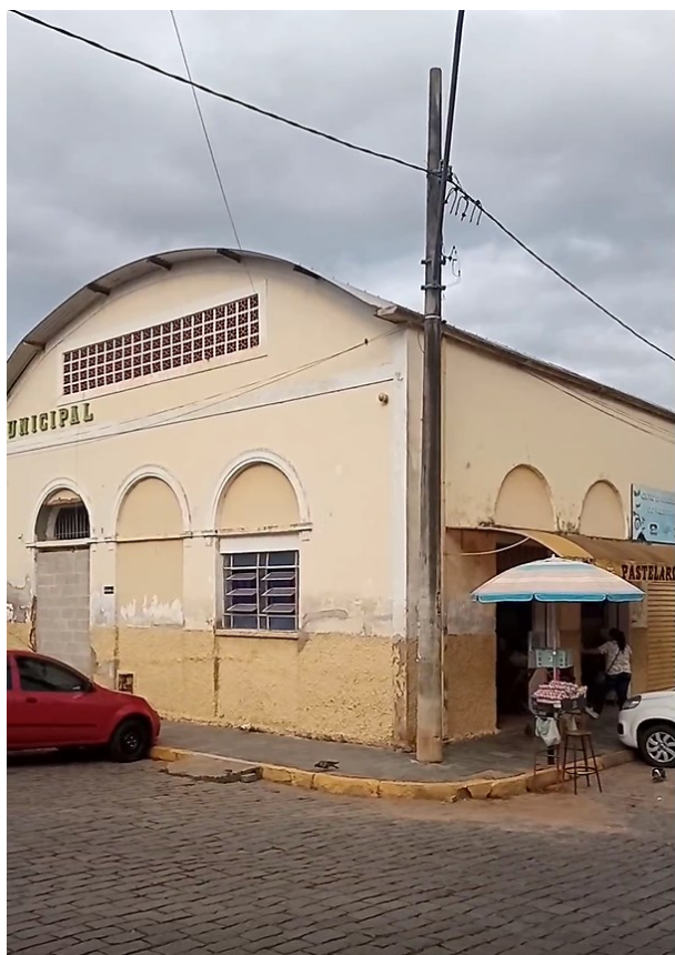
Figura 5 - Esquina Fachada Praça José Gouveia / Rua Tenente Francisco Dias