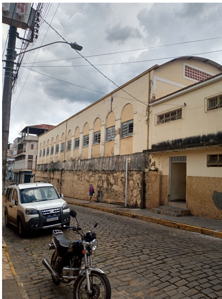
Figura 2 - Fachada Rua José Pereira da Rosa