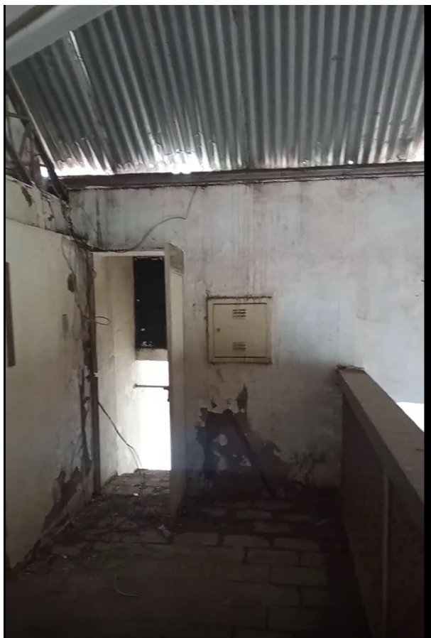
Figura 16 -Mezanino (porta de acesso)