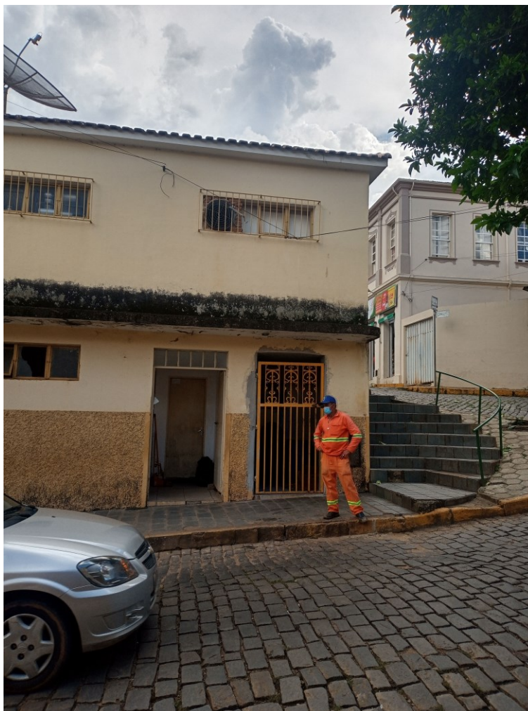
Figura 3 - Vista Sanitário público e escada esquina Rua José Pereira da Rosa /Praça José Gouveia