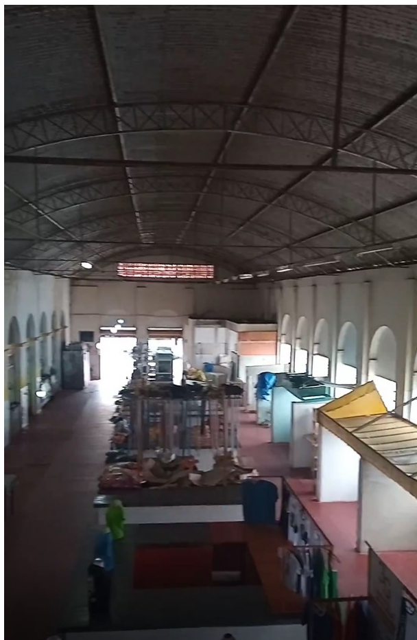
Figura 15 - Vista interna do Salão Principal (ângulo do mezanino)