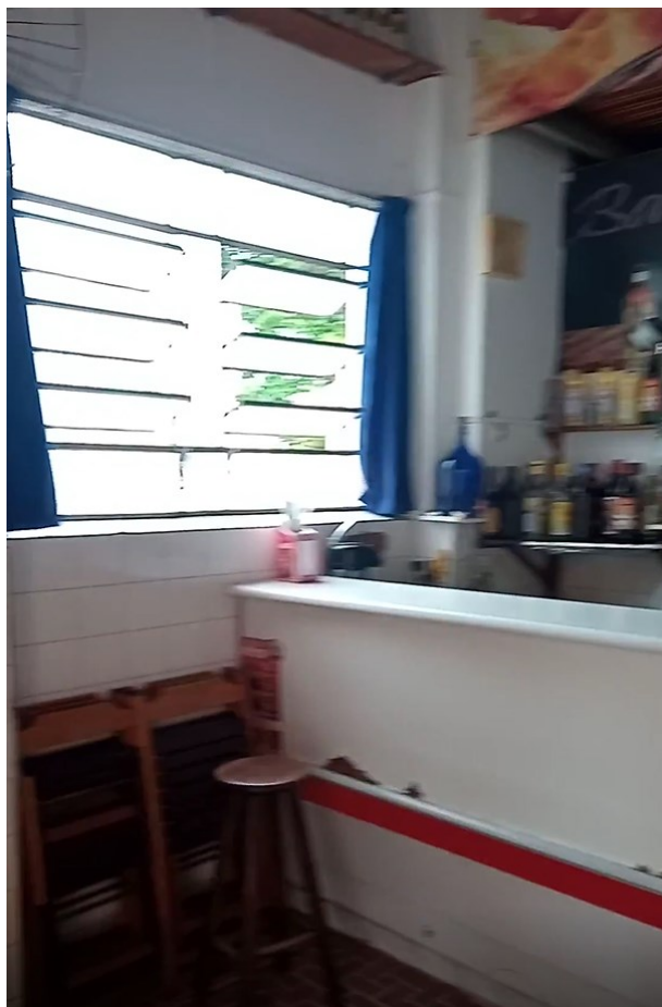
Figura 19 - Vista interna de uma das lojas externas (atual lanchonete)