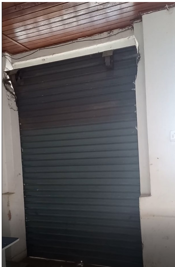
Figura 21 - Vista interna de uma das lojas externas (atual associação de agricultores)