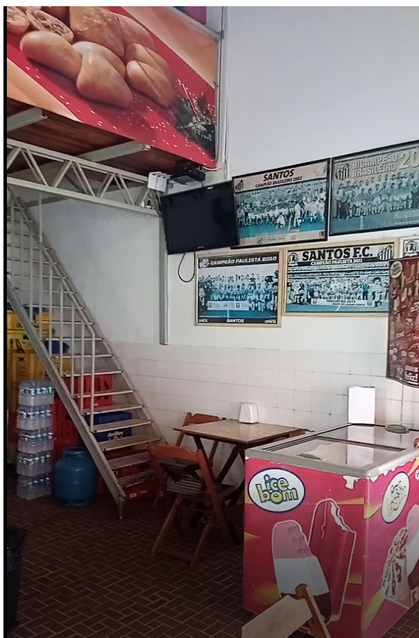
Figura 18 - Vista interna de uma das lojas externas (atual lanchonete)