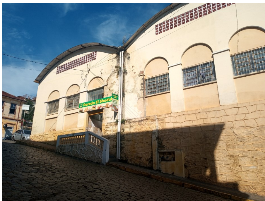
Figura 1 - Fachada Travessa Tobias Pereira