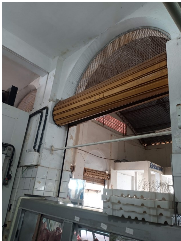
Figura 23 - Vista de uma das portas-balcão do Salão principal (atual área de frios do mercadinho)

Ana Paula Mota Alves Engenheira Civil CREA SP 5062224000