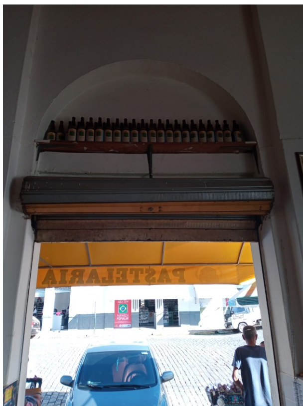
Figura 20 - Vista interna (porta e arco) de uma das lojas externas (atual lanchonete)