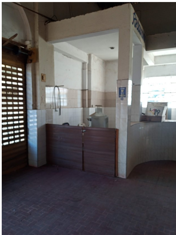
Figura 10 - Vista interna do Salão Principal (antigo restaurante)