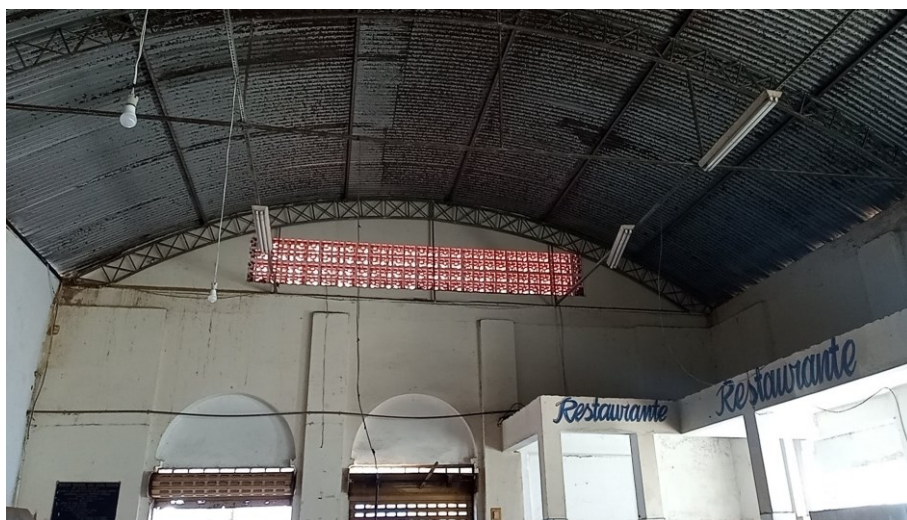
Figura 11 - Vista interna do Salão Principal