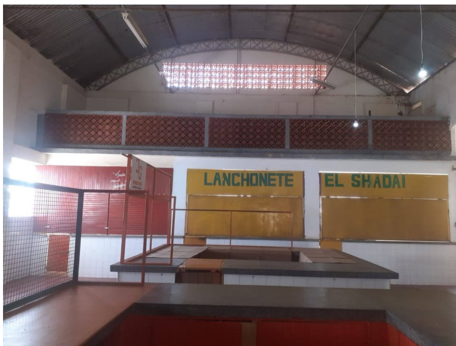
Figura 14 - Vista interna do Salão Principal (mezanino e balcões)