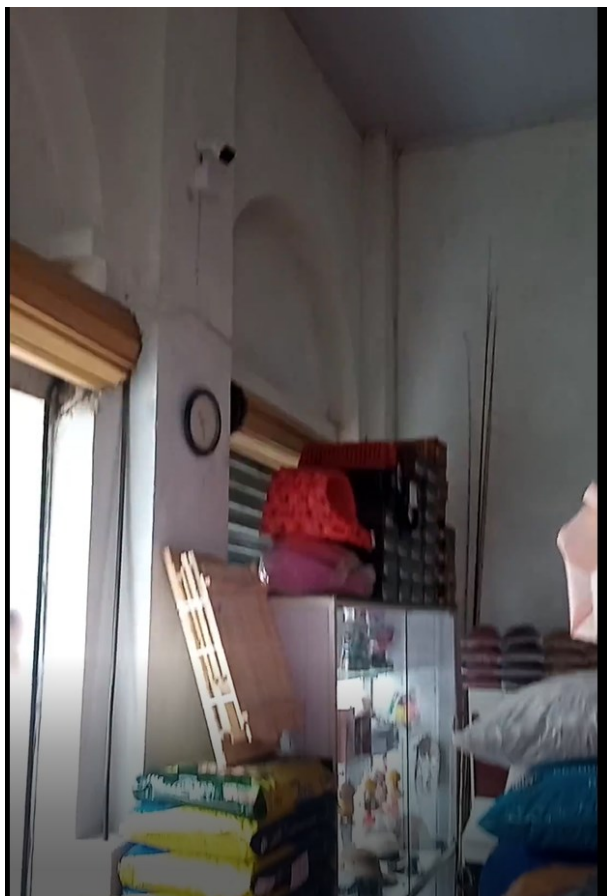
Figura 17 - Vista interna de uma das lojas externas (atual casa de rações)