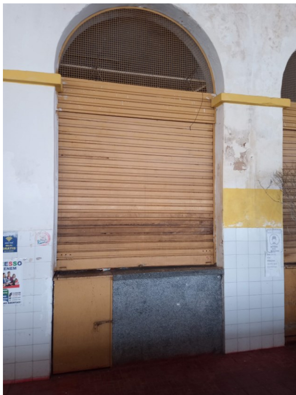
Figura 12 - Vista interna do Salão Principal (porta tipo balcão)