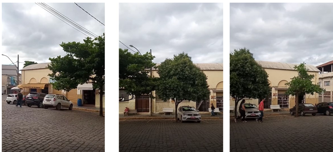
Figura 6 - Fachada Rua Tenente Francisco Dias