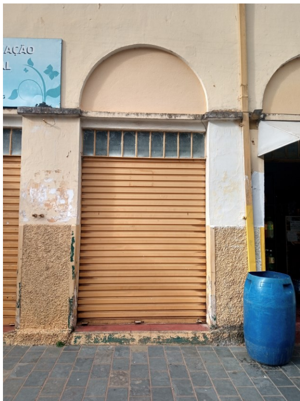
Figura 7 - Exemplo de porta tipo na fachada da Rua Tenente Francisco Dias