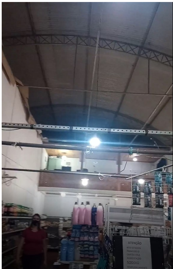
Figura 22 - Vista interna de uma das lojas externas (atual mercadinho)