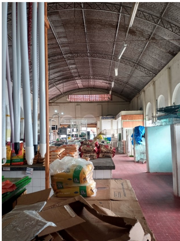
Figura 9 - Vista interna do Salão Principal